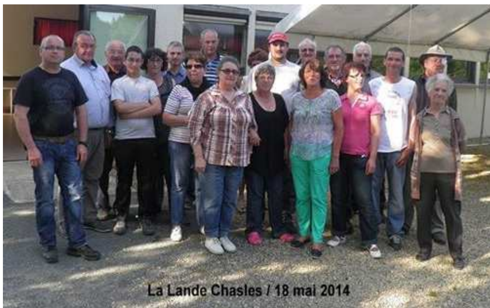
- Une partie des bénévoles -

18 mai 2014 , vide grenier sur la commune. Merci au Comité des fêtes et à tous les bénévoles qui ont permis à cette journée d'être un beau succès populaire !