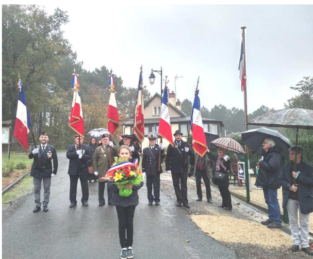
Novembre / Cérémonie du 11 novembre