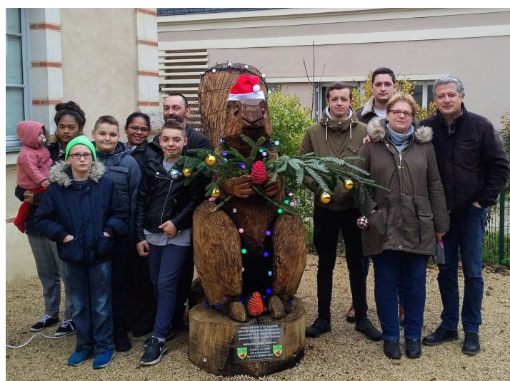
Décembre / Décoration Ecreuil

Nombreuses photos et informations sur notre page Facebook communale