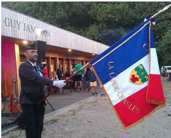
Juillet - Inauguration du Drapeau communal