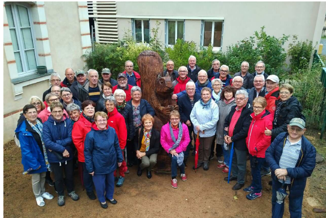
Octobre / Un groupe en séjour sur la commune