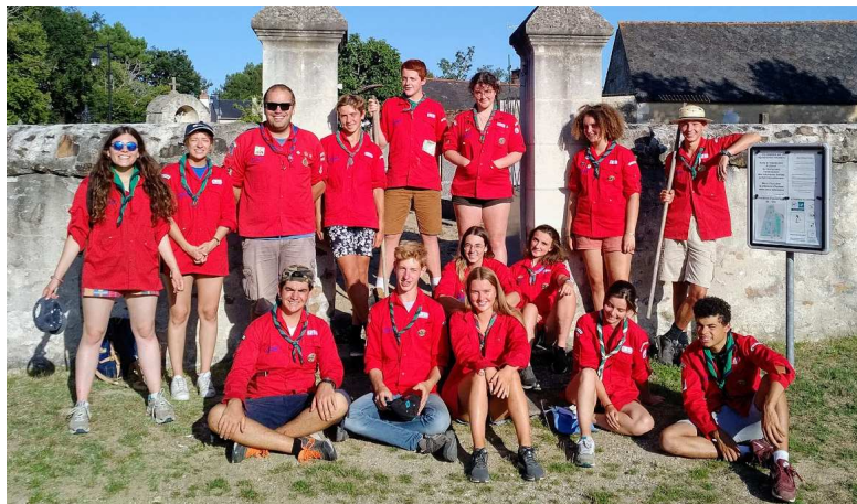
Août / Entretien du cimetière par un groupe de scouts