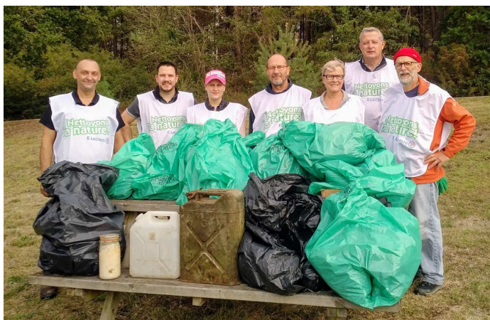
Septembre - Opération Nettoyons la Nature