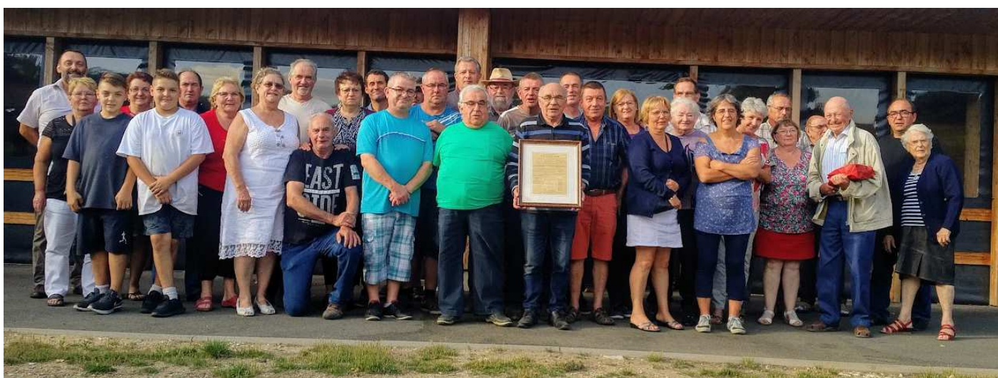
Extrait Journal officiel du 24 décembre 1908

La société L'Union a fêté ses 110 ans à la salle communale début septembre 2019. Merci à tous les participants et aux organisateurs !