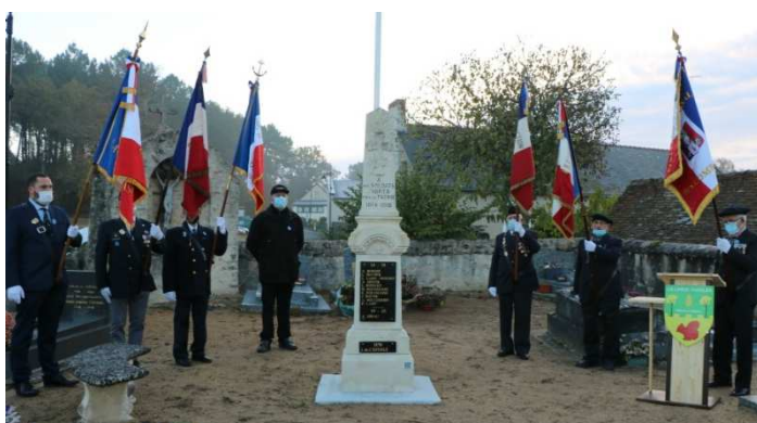
Novembre, cérémonie et remise d'insignes de porte-drapeau