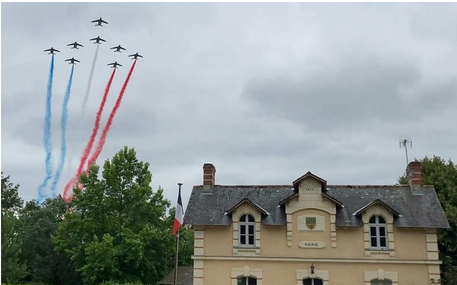
16 Juillet, Passage de la patrouille de France