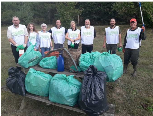
Septembre, opération nettoignons la Nature