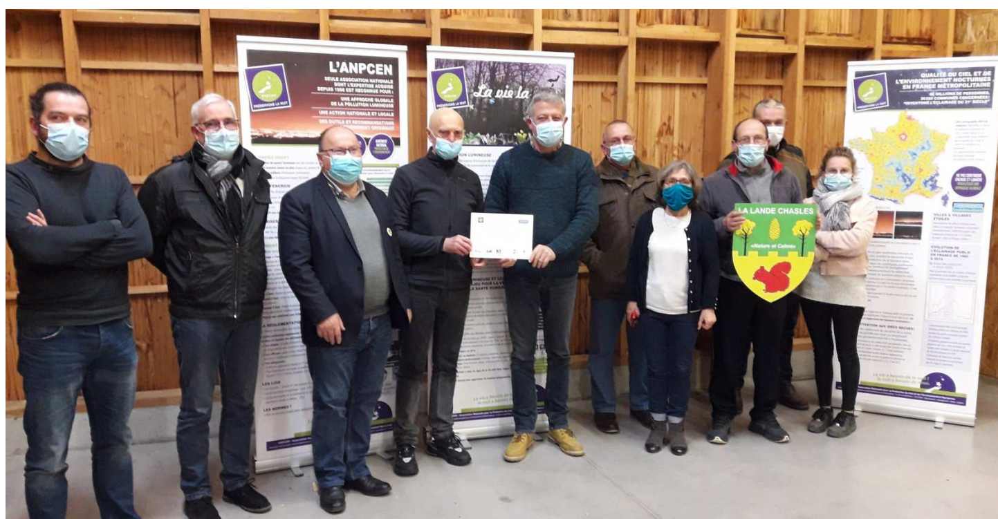
Membres du Conseil, Président et technicien du SIEML et délégués de l'ANPCEN à la remise officielle

Elles ont perdu le label : Jarzé-Villages, Gennes-Val de Loire, Ombree-d'Anjou et Morannes-sur-Sarthe – Daumeray.