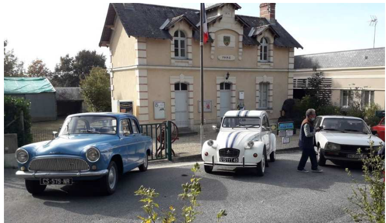
Octobre, rallye voitures anciennes, pause à La Lande-Chasles