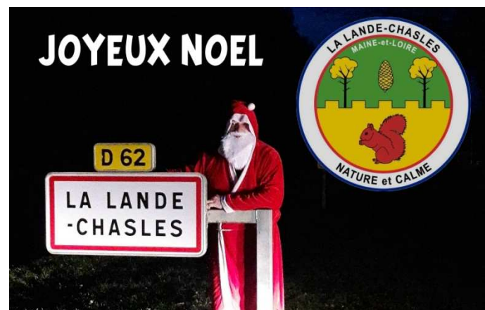
Décembre, passage du père Noël

Suivez-nous sur Facebook, Twitter et Instagram, ainsi que Tik-Tok pour tout savoir sur l'actualité de La Lande-Chasles. Grand merci à tous pour vos commentaires et échos donnés. N'oubliez pas d'aimer, commenter ou partager les posts car cela joue sur les statistiques, notamment sur Instagram et permet un meilleur classement.